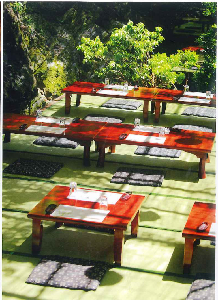
左◇川の地形に合わせて床几を設置した川床。「右源太」の川床は水面に近く、岩の段差が生む滝を随所で楽しめる。右◇昼間は木洩れ日の中で川床料理を堪能。