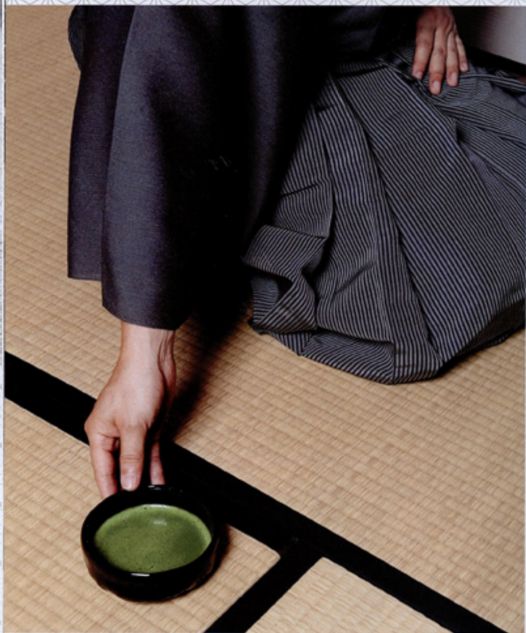
▲日本茶道完整保留了中国宋代的点茶法。