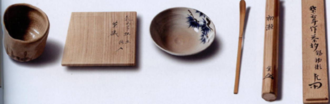
▲ 松之雄平茶碗 制作者 了入 (九代 乐吉左卫门 1756-1834) 题了庵 (九代 千宗左 表千家家家元 1775-1825) 题语者 日守山 (十六代 永乐 1917-1998) 尾形乾山 (1603-1743) 江户时代的陶工、绘师。