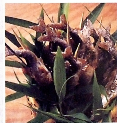
雅なしつらえの川床。新鮮な鮎の塩焼きはクセがなく絶品(写真はイメージ)