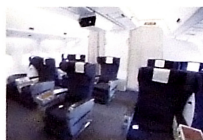
※写真はすべてイメージです。